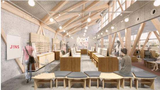
組木や高窓、学生の作品などによって演出される柔らかな雰囲気の内。