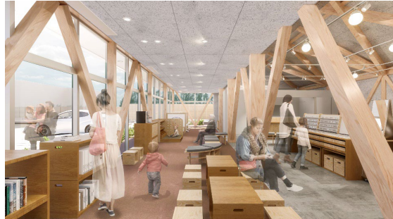
店内入口にはお客様を迎え入れるギャラリースペース。